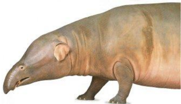
Fig 1. Een reconstructie van Moeritherium .

Een van de eerste slurfdieren is Moeritherium . Moeritheriën leefden in het Eoceen en Oligoceen ( \pm 50-35 miljoen jaar geleden), vermoedelijk in ondiepe binnenwateren langs de kust van de Tethyszee. Moeritheriën waren ongeveer zo groot als varkens. Ze hadden nog geen slurf, maar misschien wel een dikke bovenlip. De snijtanden van boven- en onderkaak waren duidelijk vergroot.