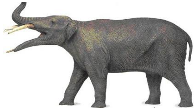
Fig 3. Gomphotherium was tot drie meter hoog en leefde ongeveer 20 miljoen jaar geleden. Vermoedelijk had hij een goed ontwikkelde slurf.

De slurfdieren uit het Mioceen die werden beschouwd als voorouders van de later geëvolueerde groepen, zijn ondergebracht in een groep die 'gomphotheriën' heet. De laatste dertig jaar zijn veel slurfdiergroepen bij de Gomphotheriidae ingedeeld, terwijl de taxonomische positie vaak onduidelijk is. Hierdoor werd deze familie een vergaarbak voor Proboscidea.