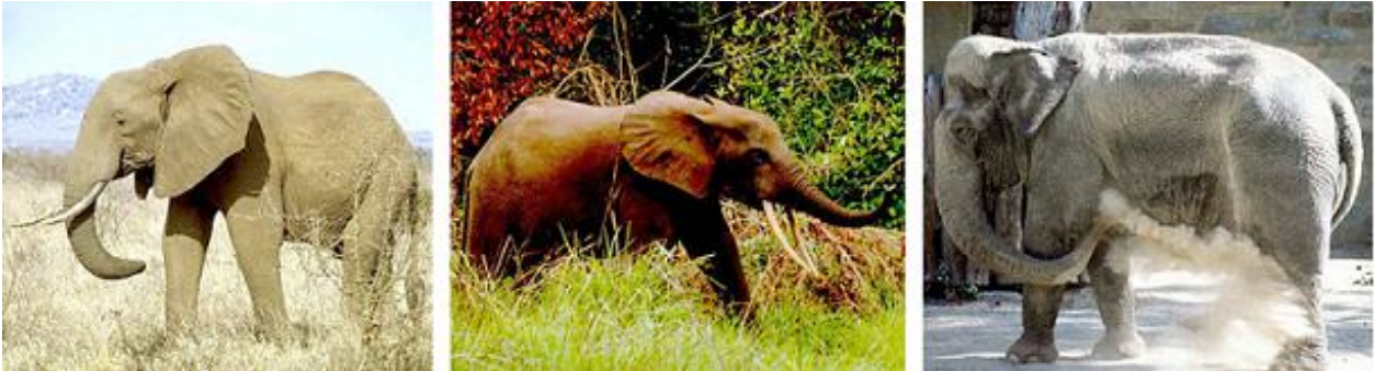
Fig 5. De recente vertegenwoordigers van de orde Proboscidea. Vlnr: Loxodonta africana , Loxodonta cyclotis en Elephas maximus .

De Indische olifant ( Elephas maximus ), Afrikaanse olifant ( Loxodonta africana ) en bosolifant ( Loxodonta cyclotis ) zijn de enige recente vertegenwoordigers. Ze verschillen op sommige punten sterk van elkaar. Het genus Elephas is zelfs meer verwant met Mammuthus dan met Loxodonta (zie cladogram).