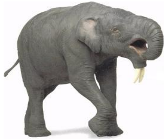
Fig 2. Deinotherium is herkenbaar aan zijn grote, omlaag gebogen slaggtanden in de onderkaak.

Deinotherium heeft een afgeplatte schedel. De uitwendige neusopening was verhoogd, wat kan duiden op een goed ontwikkelde slurf. Hij had geen slaggtanden in de bovenkaak, maar uit de onderkaak groeiden lange slaggtanden die omlaag waren gebogen. De kiezen van deinotheriën waren primitief. Ze hadden slechts twee of drie ribbels en simpele knobbels en werden verticaal gewisseld, zoals bij de meeste zoogdieren (bij olifanten gebeurt dit horizontaal: oude kiezen worden door nieuwe naar voren in de kaak geduwd). Deinotheriën aten waarschijnlijk bladeren en geen gras en werden ongeveer zo groot als moderne olifanten.